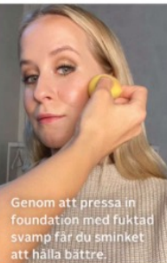
Genom att pressa in foundation med fuktad svamp får du sminket att hålla bättre.