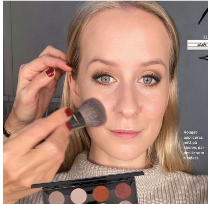
Rouge appliceras mitt på kinden, där den är som rundast.